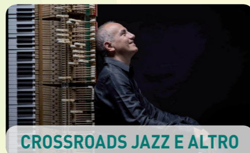
CROSSROADS JAZZ E ALTRO