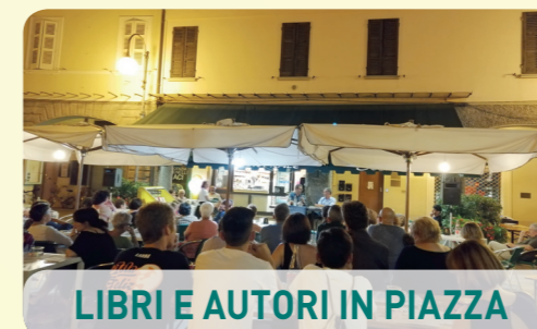
LIBRI E AUTORI IN PIAZZA