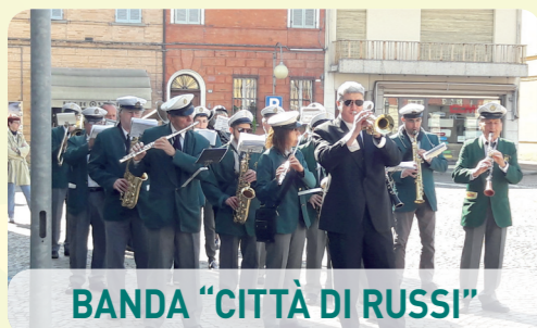
BANDA "CITTÀ DI RUSSI"

Per essere costantemente aggiornati vi invitiamo a consultare il sito: www.comune.russi.ra.it