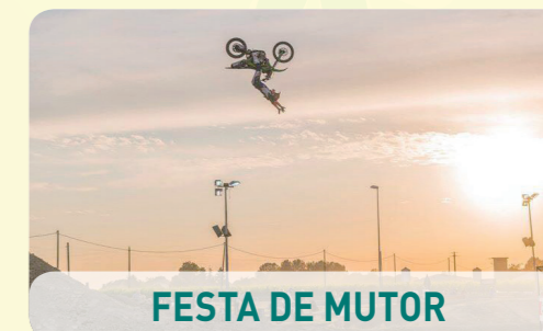
FESTA DE MUTOR